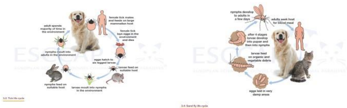
Figure 7 – Disa parazita gjakthithës të përbashkët (rriqëra dhe mushkonja)

(foto ilustruese në lidhje me parazitët)