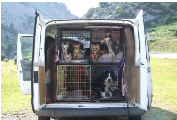
Figure 2 – Si të transportohen kafshët të kapura (Matthews, 2019)