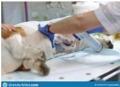
Figure 6 – Trajtimi post operator

Antibiotik lokal Spray Antibiotik Përgjithshëm në rrugë paranterale