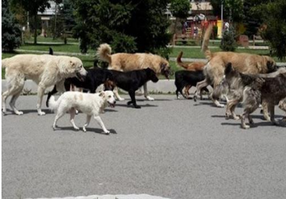
Figure 4 – Qentë në Lezhë pa matrikull (Panorama.al, August 2018)