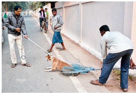
Figure 1– Skenë kapje mekanike të një qeni në Indi (Pati, 2021)